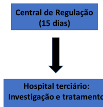
Fluxograma 3: Abordagem do paciente com cefaleia crônica progressiva