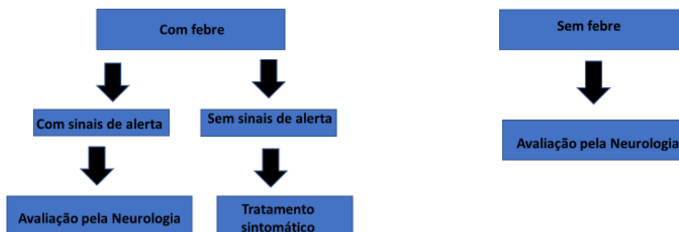
Fluxograma 4: Abordagem do paciente com cefaleia aguda emergente